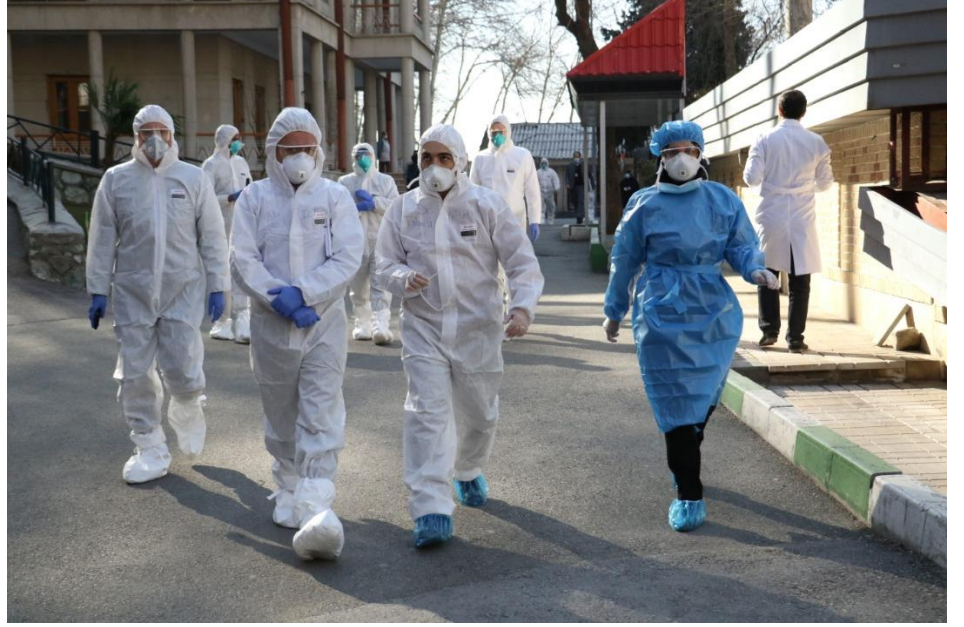
البعثة التقنية للمنظمة في إيران لدعم الاستجابة الحالية لفاشية مرض كوفيد-19

عدد البلدان على مستوى العالم التي تم تزويدها بإمدادات مختبرية ومعدات الوقاية الشخصية من مركز الإمدادات اللوجستية التابع للمنظمة في دبي، منها 13 بلدًا في إقليم شرق المتوسط